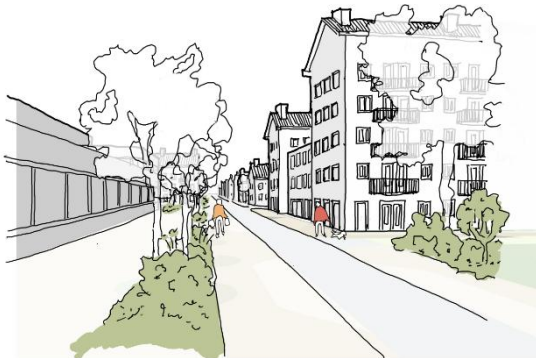
Oost gezien vanaf Hotel V