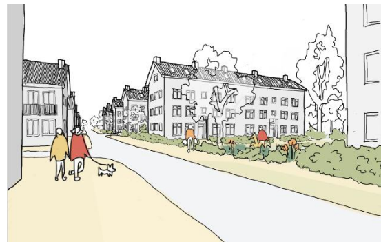
Zuid gezien vanaf de Peerelstraat