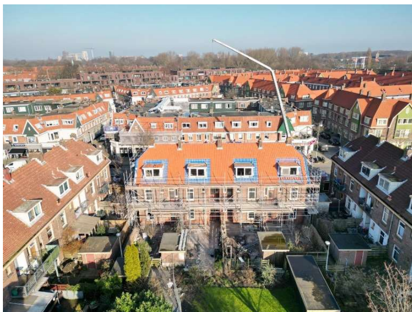
Foto: achterzijde startblokje aan Hagedoornweg 47 t/m 53.

Verder heeft de projectcommissie een bezoek gebracht aan het startblokje (de 8 gerenoveerde woningen aan de Hagedoornweg) om alvast te zien hoe de renovatie vordert.