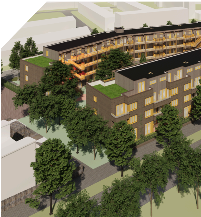
Aanpassing 1: TopNaefflaan, hoek Orionweg